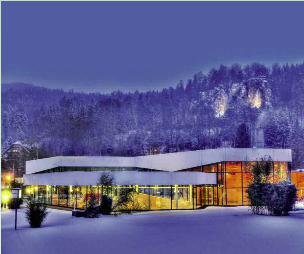
SinnesErlebnisse für ganz unterschiedliche WohlgefühlBedürfnisse – das bietet die Siebentäler Therme in Bad Herrenalb.