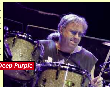
17.2.: Ian Paice – Deep Purple

Deep Purple wird seit den 70er Jahren als eine der innovativsten und erfolgreichsten Rockbands aller Zeiten gefeiert und daran hat das Schlagzeugspiel von Ian Paice einen großen Einfluss. Ihre Musik ist gekennzeichnet durch die Ausgewogenheit zwischen generaler Musikalität und monumentaler Einfachheit. Paice selbst spielte neben Deep Purple unter anderem auch bei Whitesnake, Gary Moore sowie bei Soloprojekten von Jon Lord, Paul McCartney und Pete York von der Spencer Davis Group. Perpendicular ist die einzige Deep Purple Tribute Band, die jemals mit den Original Deep Purple-Mitgliedern gespielt hat. Ian Paice wird zusammen mit Perpendicular live und ganz nah in Clubatmosphäre zu erleben sein. Da wird keine Videoleinwand benötigt, denn Ian Paice wird nur wenige Meter vom Publikum entfernt seine einzigartige Spielweise aufführen und das mit einem Programm, in dem alle Deep Purple-Klassiker vorkommen. Die Mitglieder der Band sind allesamt professionelle, internationale Musiker mit Top-Referenzen, die Band ist die meist gebuchte Deep Purple Band der letzten Jahre. Am Freitag, 17. Februar um 20 Uhr in der Festhalle Durlach.