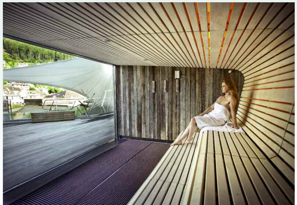
Gesundes Saunieren und ein herrlicher Ausblick zugleich: Die Panoramasauna im Palais Thermal in Bad Wildbad.

■ Palais Thermal 75323 Bad Wildbad Telefon (0 70 81) 303-0 Weitere Informationen unter www.palais-thermal.de