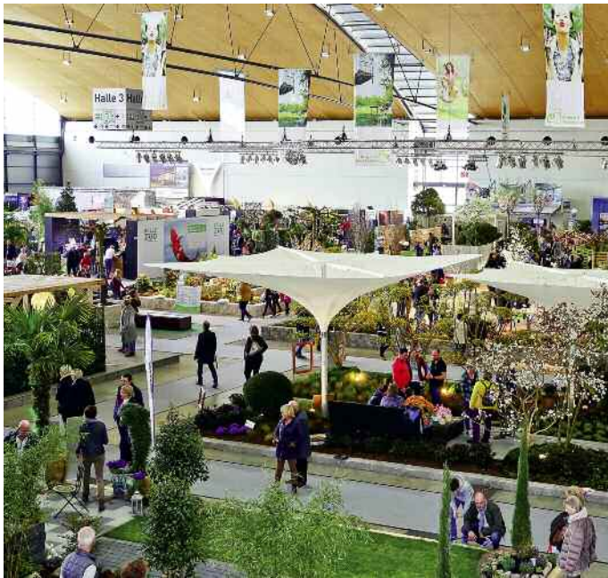
Untergliedert in die Bereiche Garden, Living und ECO Building entführt die Inventa die Besucher der Messe Karlsruhe vom 10. bis 12. März in exklusive Themenwelten. → Seite 38

Zeitlose Klassiker der Musicalgeschichte und Hits aus den aktuellen Erfolgsproduktionen vereinen sich in „Die Nacht der Musicals“ auf ihrer 20-jährigen Jubiläumstournee zu einem untrennbaren Ganzen. → Seite 14