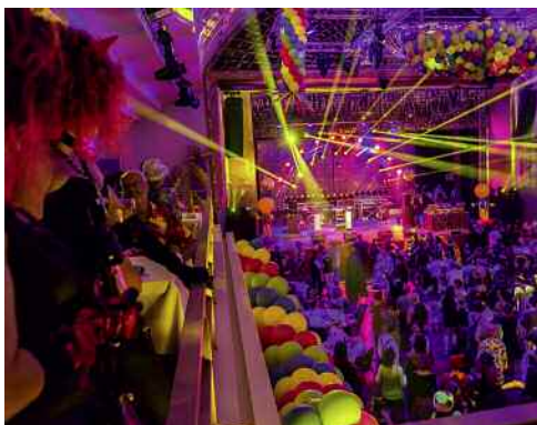
Das Kurhaus Baden-Baden wird wieder zur Fastnachtshochburg einer ganzen Region. Der legendäre Skiball verspricht auch in diesem Jahr wieder beste Partystimmung mit zwei DJs und zwei Bands. → Seite 23

Zeitlose Klassiker der Musicalgeschichte und Hits aus den aktuellen Erfolgsproduktionen vereinen sich in „Die Nacht der Musicals“ auf ihrer 20-jährigen Jubiläumstournee zu einem untrennbaren Ganzen. → Seite 14