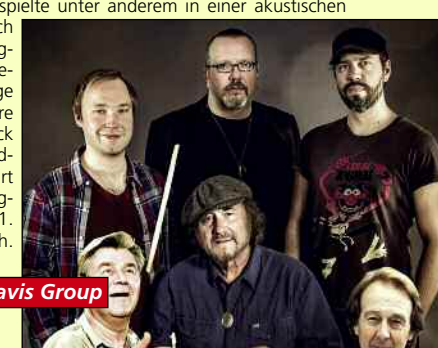
31.3.: Spencer Davis Group

Ihre internationalen Top-Hits „Keep On Running“, „Somebody Help Me“, „Gimme Some Lovin“ und „I’m A Man“ sind Klassiker, die Band selber eine Rocklegende: The Spencer Davis Group! 2017 tritt die Band in besonderer Besetzung an: Sie umfasst neben den beiden Gründern Spencer Davis (Gitarre, Gesang) und „Super Drumming“-Initiator Pete York auch Miller Anderson und seine Band. Spencer Davis, der die Band 1963 gründete und mit ihr in den 60er Jahren einige große Hits hatte, war auch als Solokünstler erfolgreich und spielte unter anderem in einer akustischen Blues- und Folkband. Pete York zählt auch heute noch zu einem der besten Schlagzeuger der Welt, sein Können stellt er regelmäßig bei Performances mit Helge Schneider unter Beweis. Der legendäre Miller Anderson, der bereits in Woodstock gerockt hat, ist seit 1984 fester Bestandteil der Band. Der Sänger/Gitarrist tourt auch mit seiner eigenen Gruppe erfolgreich durch ganz Europa. Am Freitag, 31. März um 20 Uhr in der Festhalle Durlach.