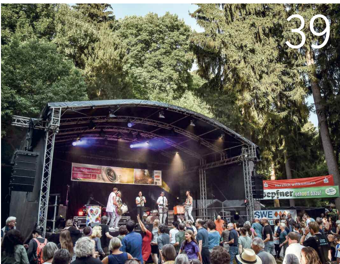
Spider Murphy Gang beim großen Open-Air am Schloss