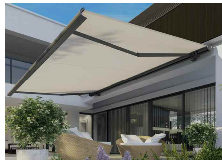
Klassische Gelenkarmmarkisen haben einen leichten, schwebenden Charakter.

Gute Ergänzungen als Blendschutz bieten senkrecht angebrachte Sonnenschutzsysteme. Für Gelenkarmmarkisen eignen sich hier vor allem sogenannte Vario Volants, die am vorderen Ausfallende der Markise sitzen und getrennt von der Hauptmarkise ausgefahren werden können. An der tragenden Konstruktion von Glasdächern lassen sich auch zusätzliche Senkrechtmarkisen anbringen, die nach dem Prinzip von Fenstermarkisen funktionieren.