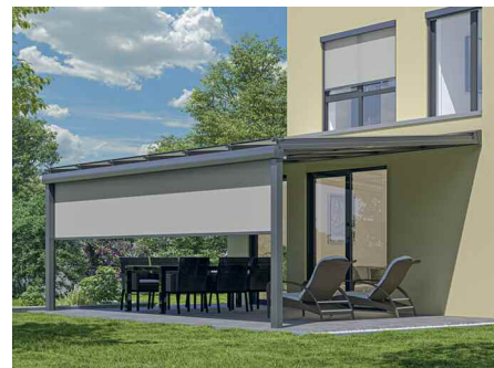
Glasdächer in Kombination mit Markisen bieten perfekten Wetterschutz zu fast jeder Jahreszeit.