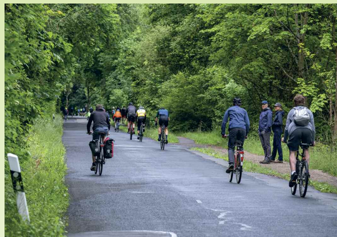
Durlacher Turmbergrennen: 120 Höhenmeter mit bis zu 13 Prozent Steigung.

Papierflohmarkt am Samstag, 17. Juni von 8 bis 15 Uhr in Ettlingen. Der Markt wird entlang der Alb aufgebaut, von der Hirschgasse bis zur Sternengasse. Verkauft werden können Bücher und Papier, also alles, was aus Papier ist, wie z.B. Zeitungen, Zeitschriften, Kunstblätter, Sammelbilder, Musiknoten, Bierdeckel, Briefmarken u.v.m. Aufbau ist ab 7 Uhr (nicht früher!), der Abbau sollte um 16 Uhr beendet sein. Das Be- und Entladen mit dem PKW ist möglich. Der Markt kann von zwei Seiten, Friedrichstraße/Albstraße und Kronenstraße/Ecke Hirschgasse, angefahren werden. Während des Marktes können die Autos auf den freigehaltenen Parkplätzen entlang der Friedrichstraße und beim Parkplatz der Thiebautschule kostenlos abgestellt werden. Mitmachen kann jede/r. Der laufende Meter kostet 5 Euro, die maximale Standtiefe darf 1,50 Meter nicht überschreiten. Die Länge entscheidet der Aussteller bzw. die Ausstellerin selbst. Angeschlossen ist