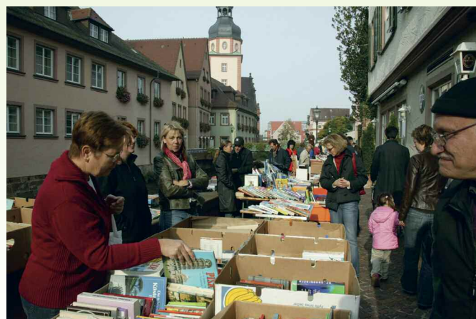
Pariser Flair entlang der Alb beim Bücher- und Papierflohmarkt in Ettlingen.